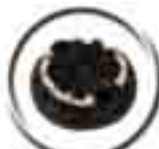
SF522 "ICE GRAB" Neige et glace