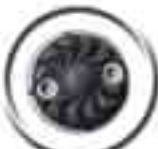
SF519 "STREET CAP" Été