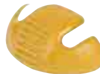
SF516 Cap protecteur