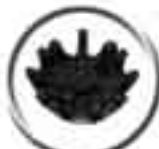
SF520 "SCORPION" Gazon et neige