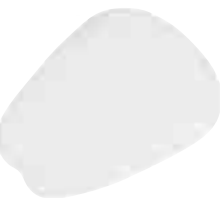
SF514 Languette de feutre