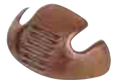
SF518 Cap protecteur