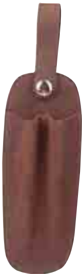
SF505 Étui à crayon et couteau