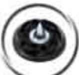
SF521 "ICE GRIPPER" Foresterie et glace