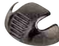
SF517 Cap protecteur